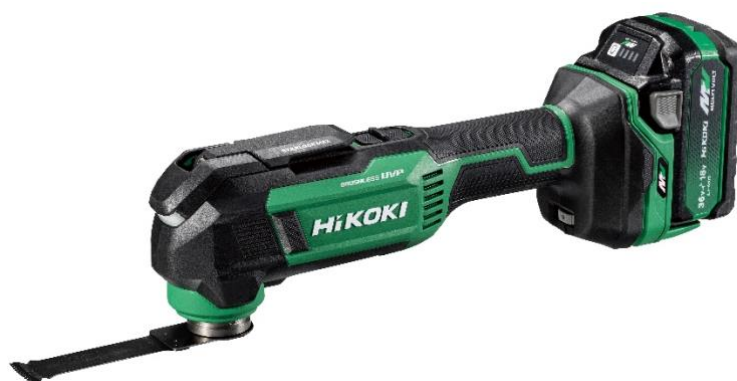
【コードレスマルチツール CV 36DMA】