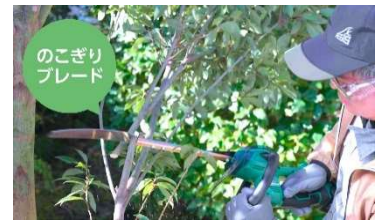
のこぎりブレード

別売りの「のこぎりブレード」に交換すれば枝打ち作業、「せんていブレード」に交換すれば低木のせん定作業が可能です。