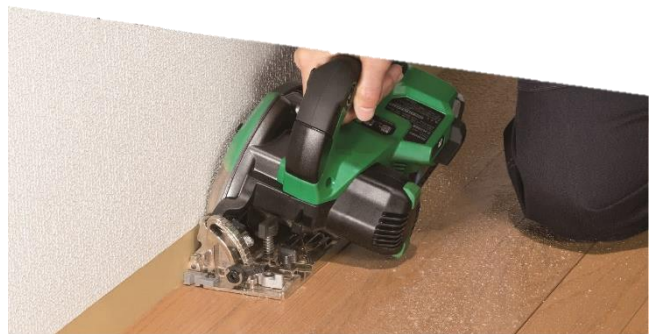
当製品の作業イメージ

工機ホールディングスは、今後もコードレスの機動性にパワフルさを兼ね備えたマルチボルトシリーズのラインアップ拡充を図ってまいります。