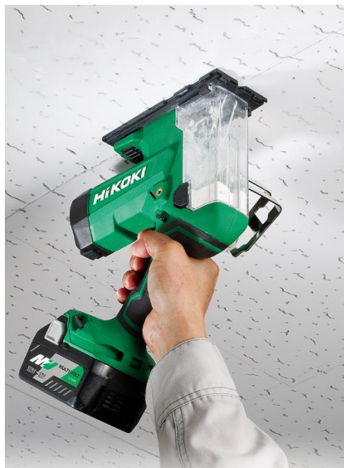
当製品の作業イメージ

フリーダイヤル(無料):0120-20-8822 ナビダイヤル(有料):0570-20-0511