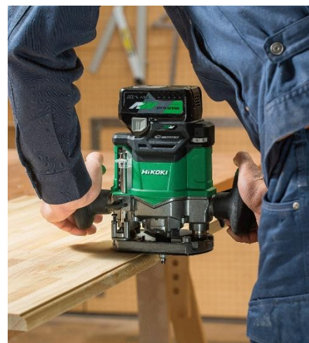
当製品の作業イメージ

工機ホールディングスは、今後もコードレスの機動性にパワフルさを兼ね備えたマルチボルトシリーズのラインアップ拡充を図ってまいります。