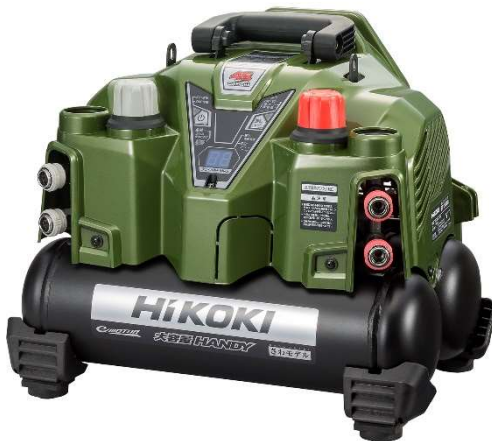
EC 1245H3(FG) フォレストグリーン