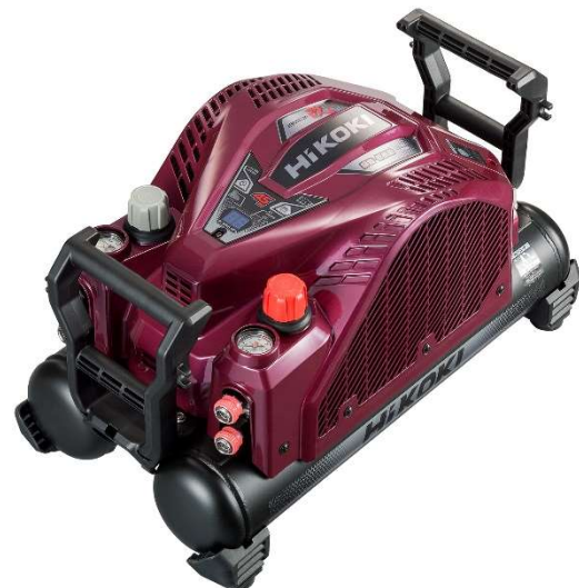
EC 1445H3(FR) フレアレッド

エアコンプレッサは動力源としての圧縮空気を発生させる装置で、プロの職人が住宅建築などで釘を打ち込む作業に用いる工具・釘打機と接続して使用します。