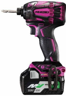
パワフルレッド&ブラック