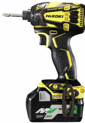
アクティブイエロー&ブラック