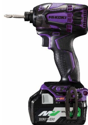
プレミアムパープル&ブラック