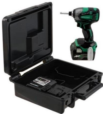
コードレスインパクトドライバ (WH 36DA)+ケース

(外装箱のサイズ:縦 100×横 70×奥行 50mm) ※2種類ありますが賞品は選べません。