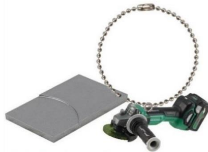
(G 3610DA) コードレスディスクグラインダ