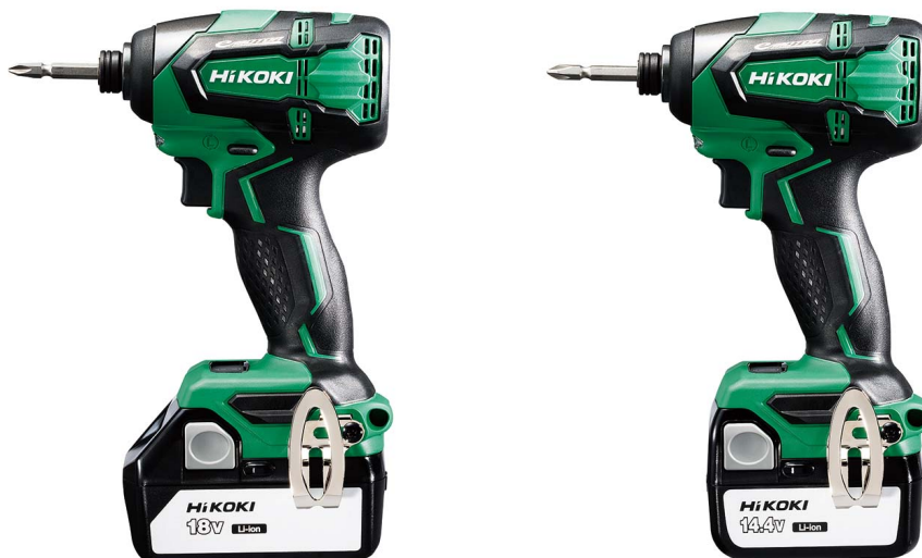
「コードレスインパクトドライバ」(WH18DB形(左)/WH14DB形(右))

工機ホールディングスは、今後とも、使われる方の視点に立った、より良い製品とサービスの開発に努め、お客様であるプロのための「極上」のユーザー体験を提供し、その情熱と信頼に応えてまいります。