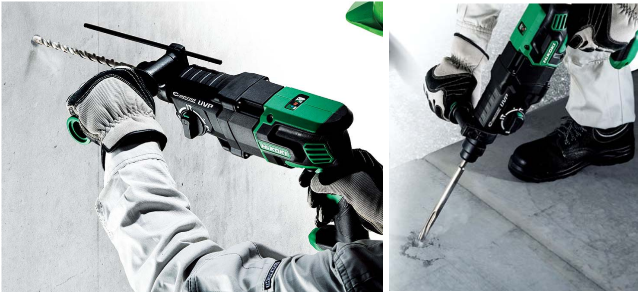
当製品の作業イメージ