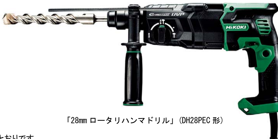
「28mm ロータリハンマドリル」(DH28PEC 形)