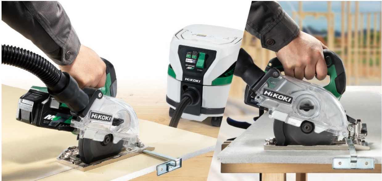
当製品の作業イメージ