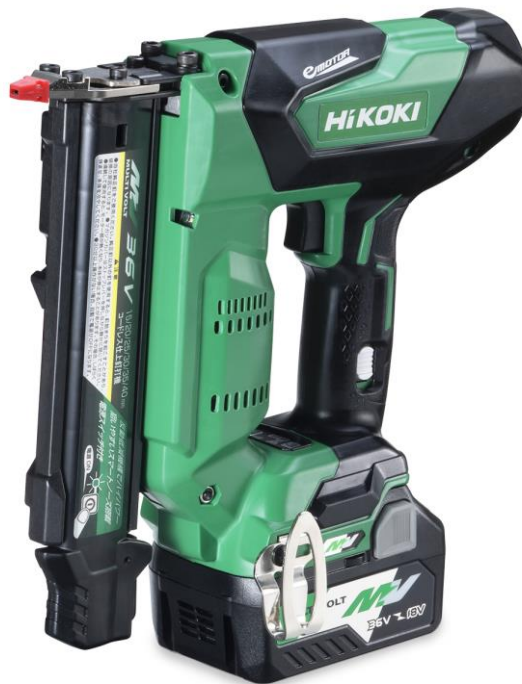
「コードレス仕上釘打機 NT3640DA 形」