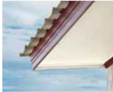
軒天仮止め・下地施行